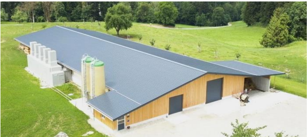
Dieser Stall für Junghennenaufzucht konnte im Jahr 2021 mit einem Investitionskredit unterstützt werden.

Die drastische Bauteuerung von rund 15% gegenüber dem Jahr 2020 (Baupreisindex), die erheblichen Ungenauigkeiten der zu planenden Baukosten und die steigenden Finanzierungskosten (Hypothekarzinsätze), haben die Entscheidungsfindung, ob jetzt gebaut oder verschoben werden soll, enorm erschwert.